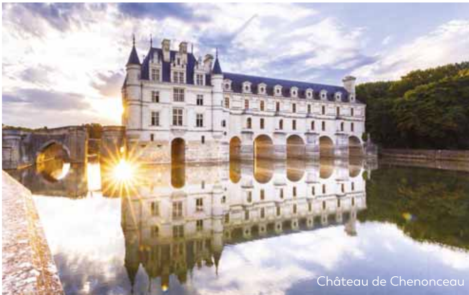
Château de Chenonceau