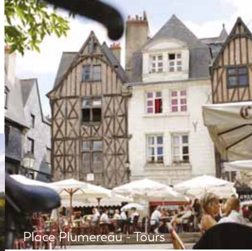
Place Plumereau - Tours