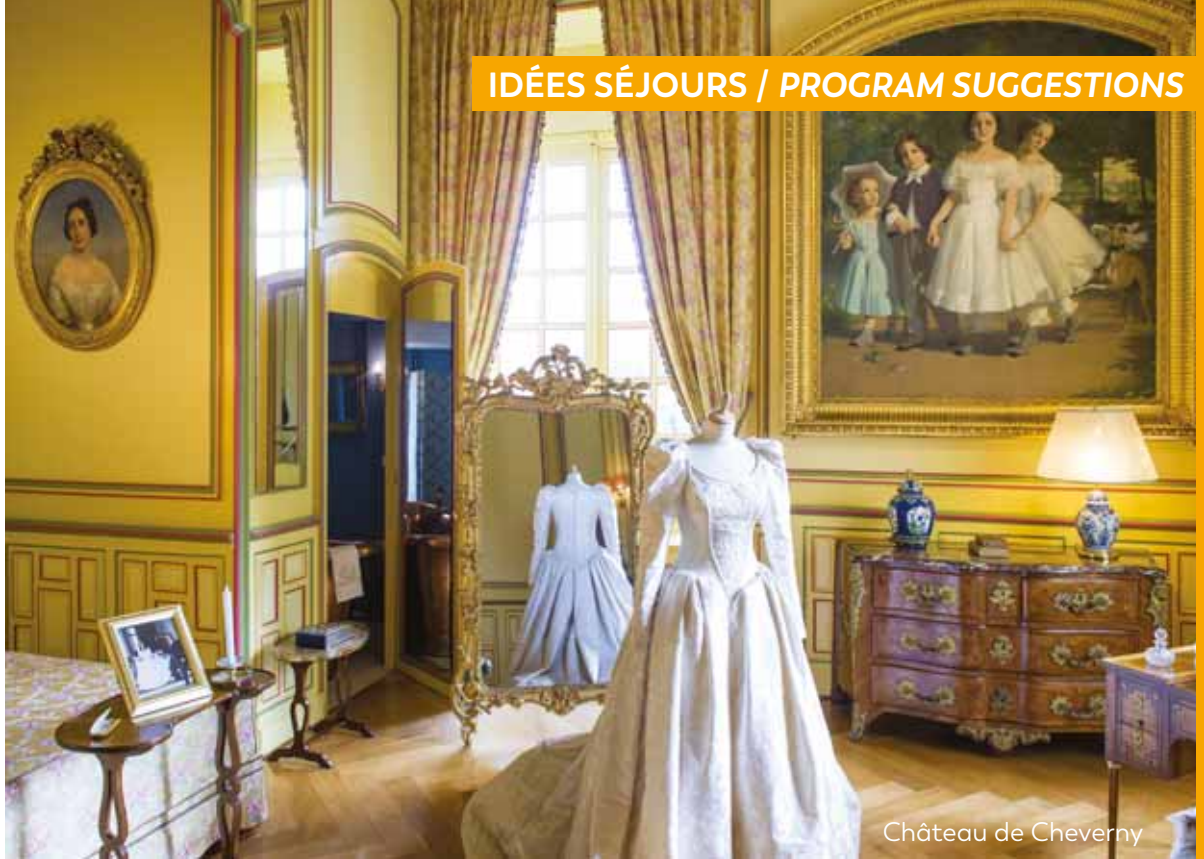
Château de Cheverny