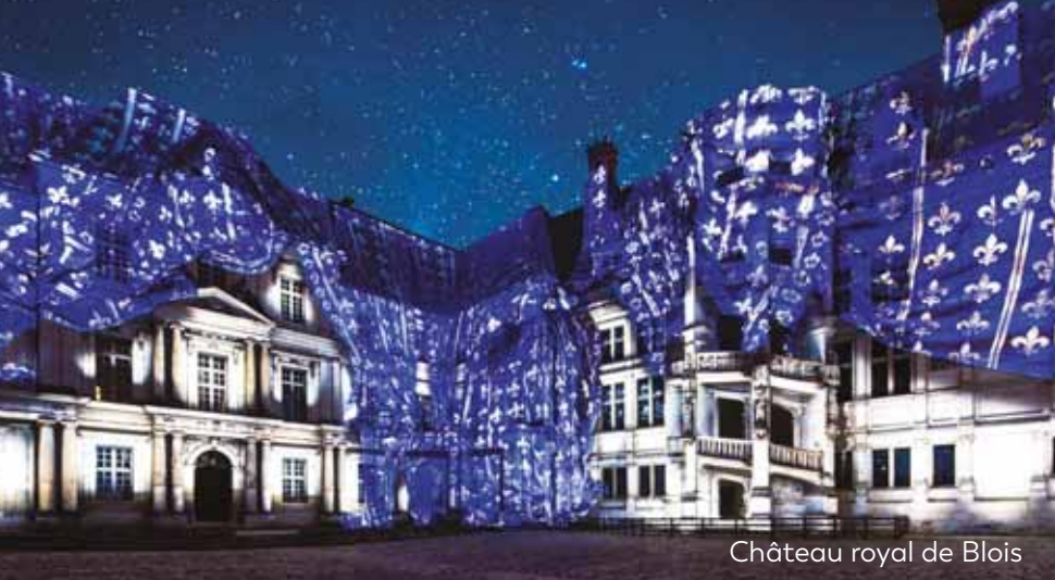
Château royal de Blois