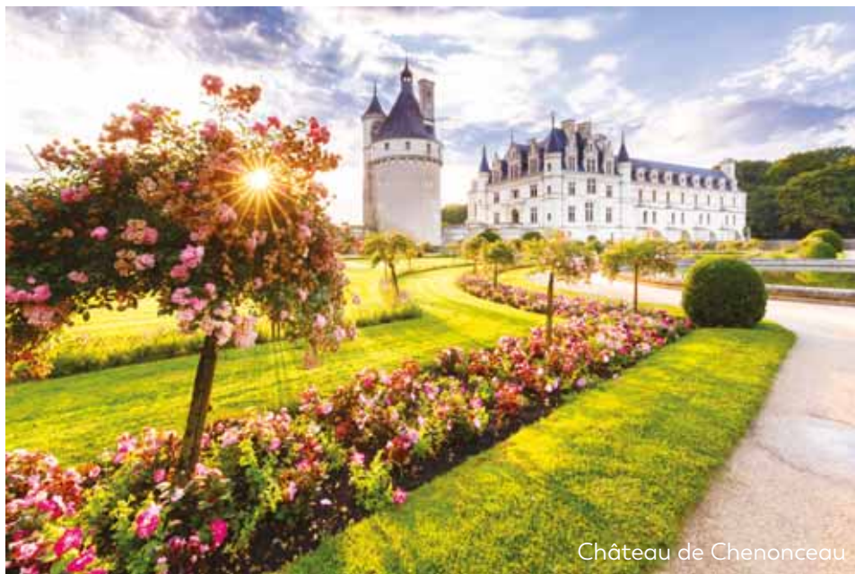
Château de Chenonceau