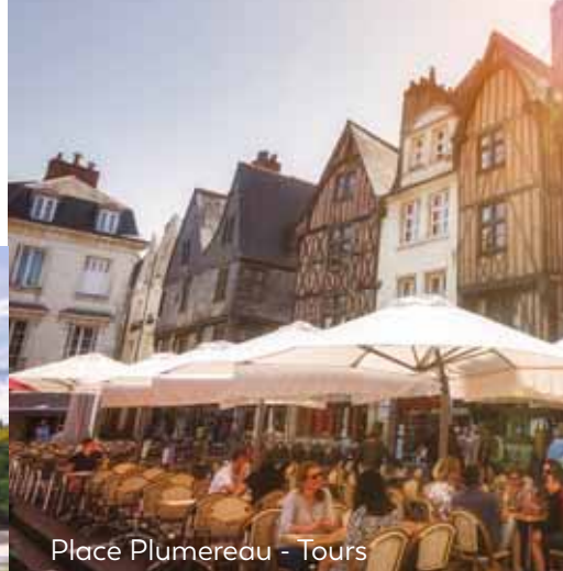
Place Plumereau - Tours