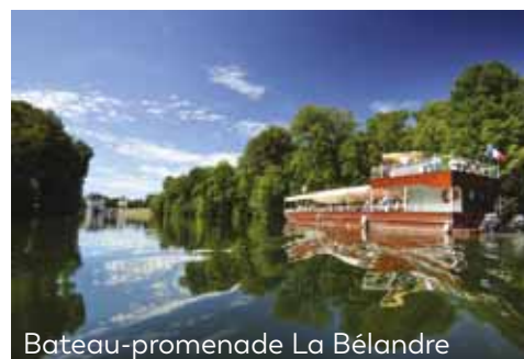
Bateau-promenade La Bélandre