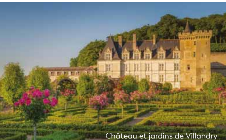
Château et jardins de Villandry

About 4.45 p.m., end of stay in the Loire Valley