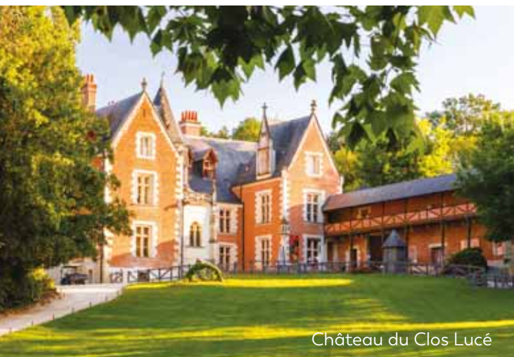
Château du Clos Lucé