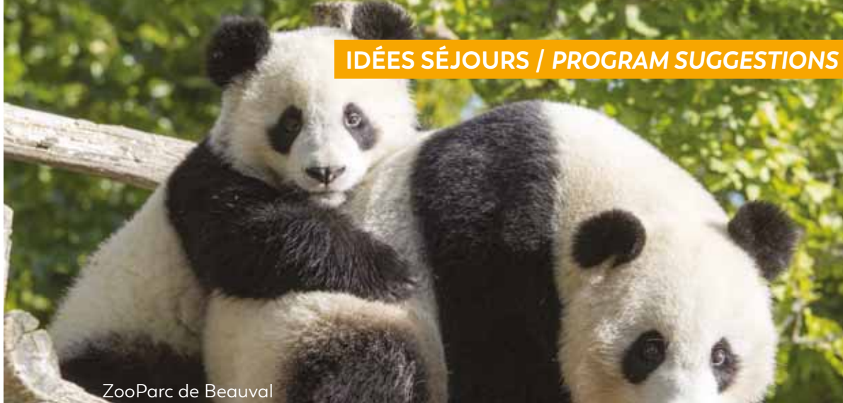
ZooParc de Beauval