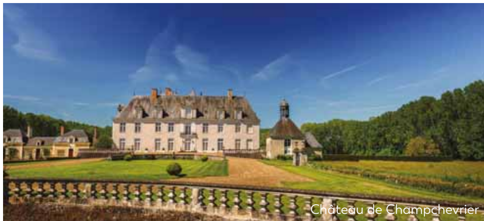
Château de Champchevrier