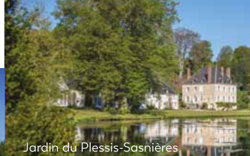
Jardin du Plessis-Sasnières