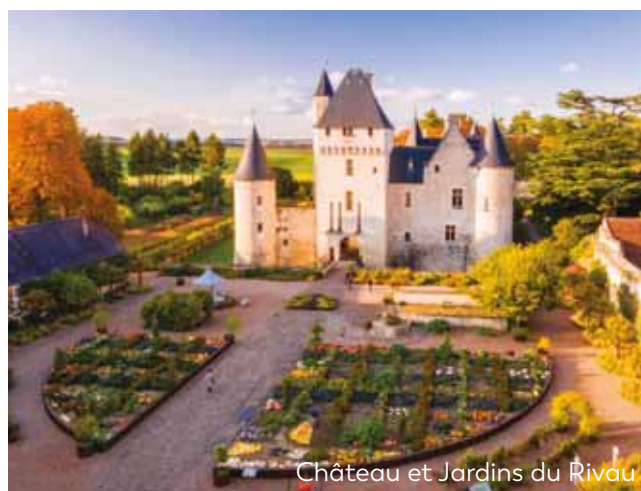
Château et Jardins du Rivau

On the south or north outskirts of Tours (Chambray, Joué-lès-Tours, Montbazou, Tours nord)