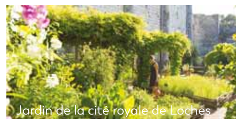
Jardin de la cité royale de Loches