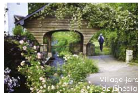
Village-jardin de Chédigny

Trajet à vélo entre l'hôtel et Canoë Company (10 mn)