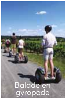
Balade en gyropode