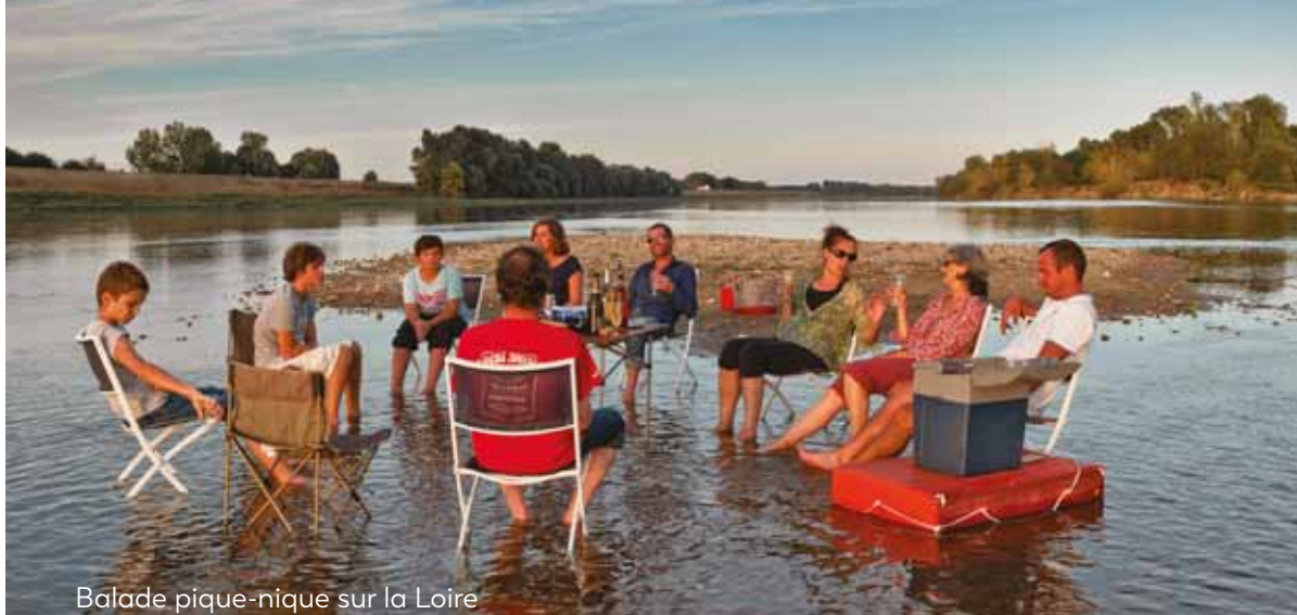
Balade pique-nique sur la Loire