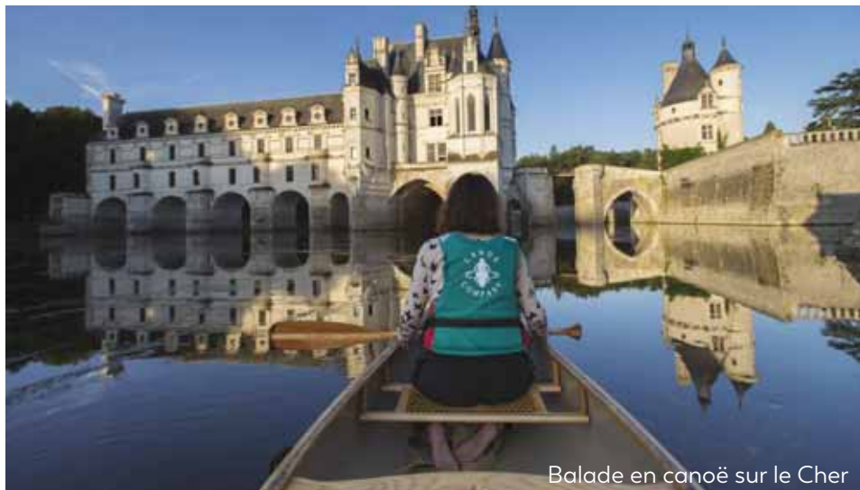
Balade en canoë sur le Cher