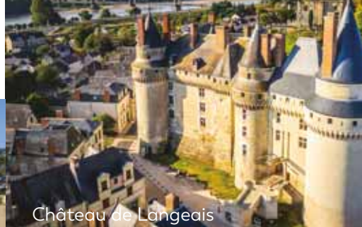
Château de Langeais