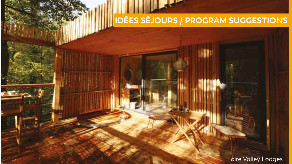
Loire Valley Lodges

Bike ride between the hotel and Canoë Company (10 mn)